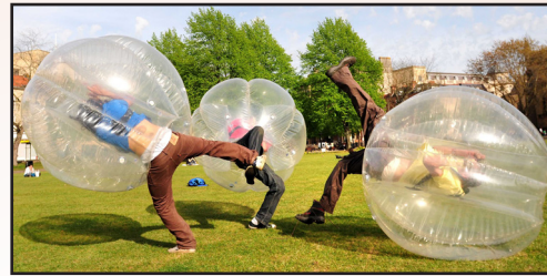
Body zorb fotboll